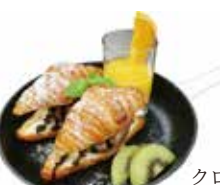
Croissant sandwich with chocolate ice cream .....¥900/set ¥700

ミックスベリーとバニラアイスクリームのパンベルデュ風味豊かなブリオッシュがベースのフレンチトーストです。苺、フランボワーズ、ブルーベリーの酸味とバニラアイスの甘味のハーモニーをお楽しみください。 ※パンベルデュのみ 17:30 L.O