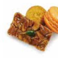
Baked goods platter .....¥400

ストロベリー&ピスタチオアイスクリーム どちおとめのアイスクリームとピスタチオアイスクリームに、フレッシュのいちご、グラノーラ、濃厚なベリーソースをあわせたアイスクリームです。