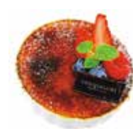
Crème brûlée クレームブリュレ

濃厚なクリームチーズを使用したコクのあるチーズケーキ。ハチミツクリームとチーズのマリアージュをお楽しみいただけます。