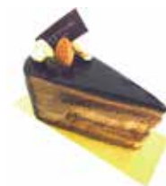
Anniversaire chocolat アニヴェルセルショコラ

マリッジリングとウェディングドレスの“純白”を表現した“Blanche”。米粉をブレンドして白くしっとり焼き上げたスポンジ生地にバニラ風味の低脂肪クリームと苺をサンドしたローカロリーでライトなショートケーキ。