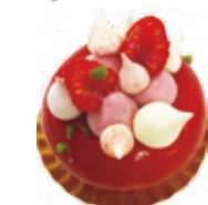
Porto Rouge ポルトルージュ

ナッツ、グリオットチェリーの豊かな香りと食感を優しいハチミツ風味のパバロワで包み、キルシュ風味のシロップをしみ込ませたスポンジでサンドしました。