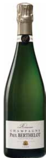
Paul Berthelot Cuvée Réserve Glass/Bottle.....¥1,600/¥9,800 ポール・ベルトロウ キュヴェ レゼルヴ

ピノ・ノワール40% ピノ・ムニエ40% シャルドネ20% エベルネの北部に位置するディジェ村にある、1884年から5世代にわたって続く家族経営の シャンパーニュ・メゾン。すべてが自社畑のぶどう栽培にはリュットリゾネ（減農薬）を採用しています。 輝きのある美しい黄金色、口中に広がる繊細な泡が心地よく、豊かな香りが広がります。 香りは、はちみつ、ミント、りんごやスパイス、ハーブが感じられ、味わいは、よく熟成したワインと ピノ・ノワールのしっかりとした重厚感、ひかえめなドサージュのドライなシャンパーニュです。