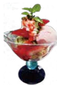
Strawberry & pistachio ice cream with berry sauce .....¥900/set ¥700

アニヴェルセル定番のロールケーキ。イチゴ、キウイ、バナナ、マンゴーをふんだんに使用し、もちもちした食感の生地で巻かれたフルーツロールケーキ。