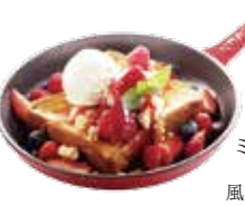
Mixed berries pain perdu with vanilla icecream .....¥1,400/set ¥1,000

パリッと香ばしいカラメルと、天然のパナリビーンズのみを使用したなめらかな口当たり良いクレームブリュレ。濃厚でクリーミーな味わいに、甘酸っぱいベリーを添えました。(提供までに少しお時間を頂きます。)