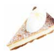
Baked cheese cake バイクドチーズケーキ

冠をイメージし季節のフルーツを飾ったタルトです。温かく優しい気持ちが伝わり、誰もが冠をかぶる特別な日に“笑顔が増えますように”との想いで作りました。