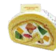
Fruits roll cake フルーツロールケーキ

上品なビターチョコレートを使用したムースとスポンジを幾層にも重ね、表面をチョコレートでコーティング。ショコラ好きにはたまらない、濃厚で香り高いチョコレートケーキ。