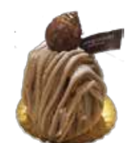
Recolte NEW レコルト

クロワッサンチョコレートアイスサンド クロワッサンに濃厚なミルクチョコアイスをサンドしました。別添えのオレンジジュースとチョコレートの相性をお楽しみください。