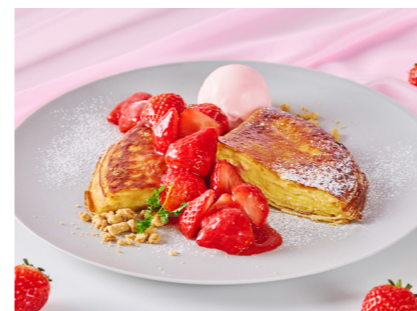
Strawberry Mille-feuille Pancakes ¥2,800 ストロベリーミルフィーユパンケーキ

( Whipped Cream ¥200 Maple Syrup ¥200 Ice Cream ¥300 French Fries ¥400 ホイップクリーム メープルシロップ アイスクリーム フレンチフライ )