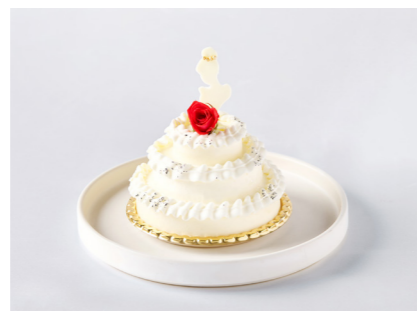
Petit Mariage ~Celebration~ ¥1,210 プチ・マリアージュ ~セレブレーション~ “花嫁”をモチーフにした、純白のウェディングドレスをイメージした特別なショートケーキ。ふわふわのスポンジに、自家製ジャムを重ねて仕上げました。