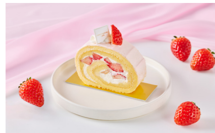
Cherry Blossom and Strawberry ANNIVERSAIRE Roll 桜と苺のANNIVERSAIREロール 単品価格 ¥880