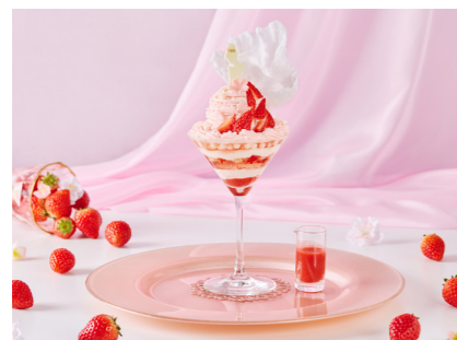
Robe de Mariée Parfait ¥2,900 ~Strawberry Celebration~ ロブ・ド・マリエ パルフェ ~ストロベリー・セレブレーション~ 平日: 12:00~20:00(限定10食) 土日祝: 14:15~18:00(限定15食)