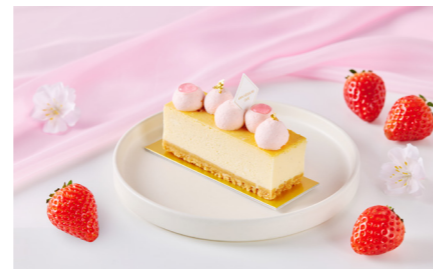
Gâteau au Fromage "Sakura" ガトー・フロマージュ“桜” 単品価格 ¥880