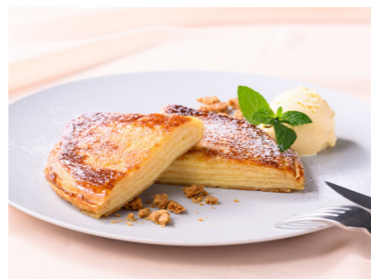
Mille-feuille Pancakes ¥1,800 ミルフィーユパンケーキ