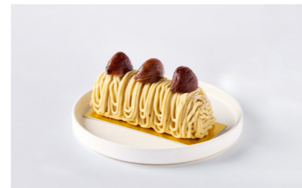
Japanese Chestnut Mont Blanc 和栗のモンブラン 単品価格 ¥1,100