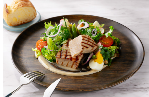
Grilled Tuna Niçoise with Colorful Vegetables and Anchovy Sauce グリルマグロのニソワーズ 彩り野菜とアンチョビソース 単品価格 ¥2,200