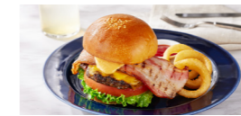
ANNIVERSAIRE Cheeseburger with Japanese Beef Patty and Bacon 国産牛パティとベーコンの アニヴェルセルチーズバーガー +¥600