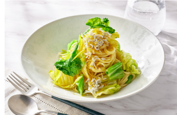
Spaghettini Aglio e Olio with Spring Vegetables, Whitebait and Bottarga Mimosa Style 春野菜としらすのアーリオオーリオ カラスミのミモザ仕立て スパゲッティーニ 単品価格 ¥2,200