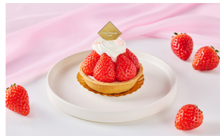
Strawberry Tart タルト・フリーズ 単品価格 ¥1,100