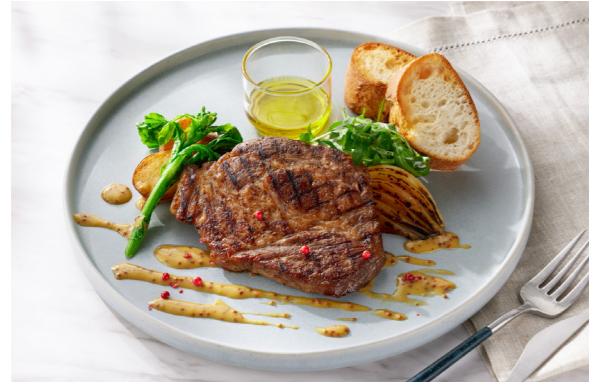
Grilled Margaret Pork with Seasonal Vegetables and Honey Mustard Sauce マーガレットポークのグリルと旬彩 ハニーマスタードソース 単品価格 ¥2,200