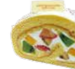
Fruits roll cake フルーツロールケーキ

なびターチョコレートを使用したムースとスポンジを幾層にも重ね、表面をチョコレートでコーティングしました。様々な食感の、ショコラ好きにはたまらない濃厚で香り高いチョコレートケーキです。