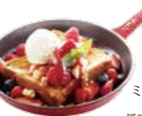
Mixed berries pain perdu with vanilla icecream .....¥1,400/set ¥1,000

パリッと香ばしいカラメルと、天然のバニラビーンズのみを使用したなめらかな口当たり良いクレームブリュレです。濃厚でクリーミーな味わいに、甘酸っぱいベリーを添えました。(提供までに少しお時間を頂きます。)