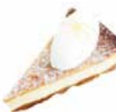
Baked Cheese cake ベイクドチーズケーキ

冠をイメージし季節のフルーツを飾ったタルトです。温かく優しい気持ちが伝わり、誰もが冠をかぶる特別な日に“笑顔が増えますように”との想いで作りました。