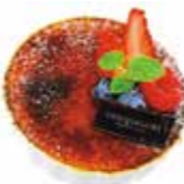
Crème brûlée クレームブリュレ

濃厚なクリームチーズを使用したコクのあるチーズケーキ。ハチミツクリームとチーズのマリアージュをお楽しみいただけます。