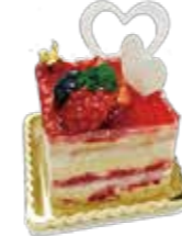
Parfait Amour パルフェタムール

ミツバチが花畑で蜜を集めている様子をイメージした、ハチミツのムースです。「春の花々のハチミツ」をたっぷり使用したムースの中央には、バニラムースと香ばしいキャラメルソース、上部にはミツバチが探しに来たハチミツレモンソースが良いアクセントになっています。