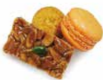
Baked goods platter .....¥400

ミックスベリーとバニラアイスクリームのパンベルデュ風味豊かなプリオッシュがベースのフレンチトーストです。苺、フランボワーズ、ブルーベリーの酸味とバニラアイスの甘味のハーモニーをお楽しみ下さい。 ※パンベルデュのみ 17:30 L.O