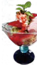
Strawberry & pistachio ice cream with berry sauce .....¥900/set ¥700

アニヴェルセル定番のロールケーキ。イチゴ、キウイ、バナナ、マンゴーをふんだんに使用し、もちもちした食感の生地で巻かれたフルーツロールケーキです。