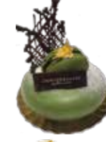
Thé Vert テ・ヴェール

焼き菓子の盛り合わせ フィナンシェやマカロンなど、小さくてかわいい3種類の焼き菓子の盛り合わせ。 少しだけ甘いものを召し上がりたいときにオススメです。