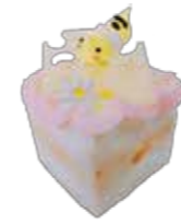
Abeille NEW アベイユ

単品 ... ¥700 ドリンクをご注文いただくと 500 円でデザートセットに出来ます。