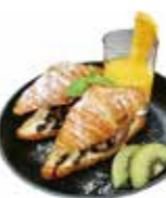
Croissant sandwich with chocolate ice cream .....¥900/set ¥700

ストロベリー&ピスタチオアイスクリーム どちおためのアイスクリームとピスタチオアイスクリームに、フレッシュのいちご、グラノーラ、濃厚なベリーソースをあわせたアイスクリームです。