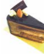
Anniversaire Chocolat アニヴェルセルショコラ

マリッジリングとウェディングドレスの“純白”を表現した“Blanche”。米粉をブレンドして白くしっとり焼き上げたスポンジ生地にバニラ風味の低脂肪クリームと苺をサンドしたローカロリーでライトなショートケーキです。